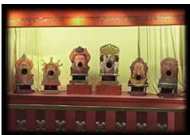
Figures de jeux de massacre