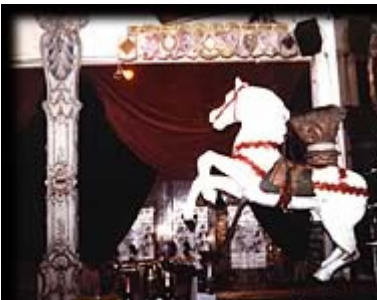
La galerie bistrot: Le Tribulum