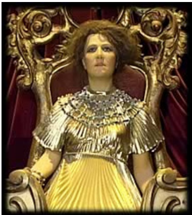
Figuration en cire de Sarah Bernhardt