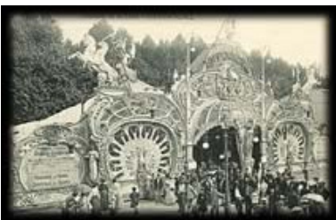
Carrousel salon: ici l'Hypo-palace

Mes diverses expériences dans la scénographie et l'événementiel me permirent de marier art et convivialité en utilisant des objets forts en tant qu'acteurs afin qu'ils conversent avec le public, permettant à ce dernier de participer. Alors a germé l'idée de créer un lieu mémoire des objets de la fête, afin de les faire vivre au présent et de les préserver pour le futur. Je ne voulais pas d'un lieu empreint de nostalgie, mais bien d'un Musée Spectacle vivant où les visiteurs traversent le miroir et deviennent acteurs dans leurs propres rêves.»