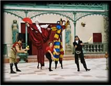
Les saltimbanques sur la piazza