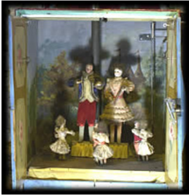
Cible de tir mécanique