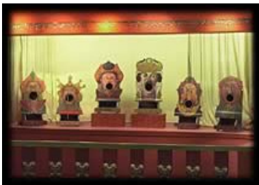
Exemple de fiche de restauration