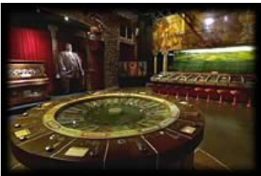
Technologies mécaniques, son, images, interactivité.

Le cheval représente alors pour les gens de la révolution industrielle déplacés des campagnes vers les villes un symbole naturel, et anoblit celui qui le chevauche.