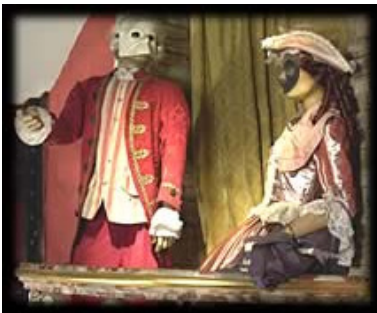
Viva la commédia dell'arté