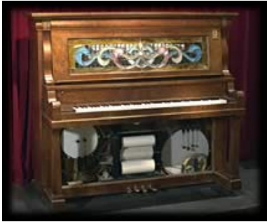
La musica meccanica: piano jazzband 1930