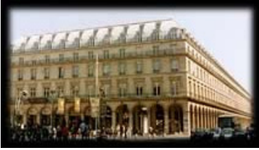
Le Louvre des antiquaires