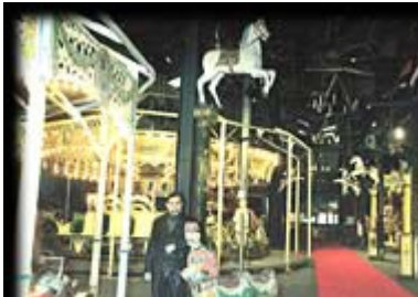
Musée de Gentilly