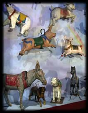
Animaux de fermes exotiques