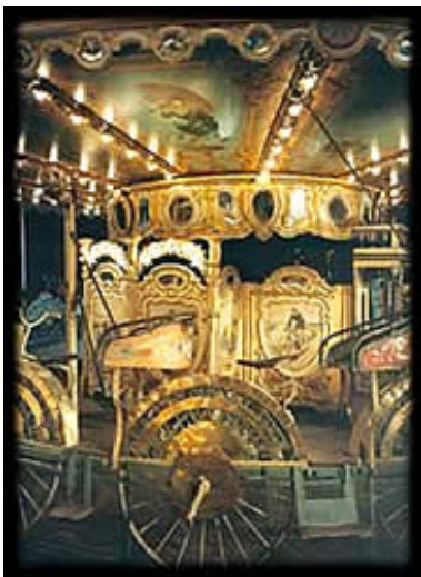
Manège de vélocipèdes 1890