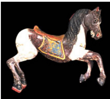
Le cheval peuple l'univers forain